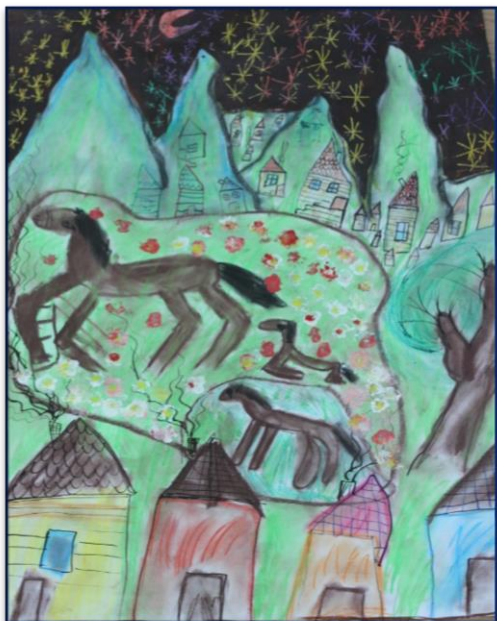
Lívia Križová - I.B